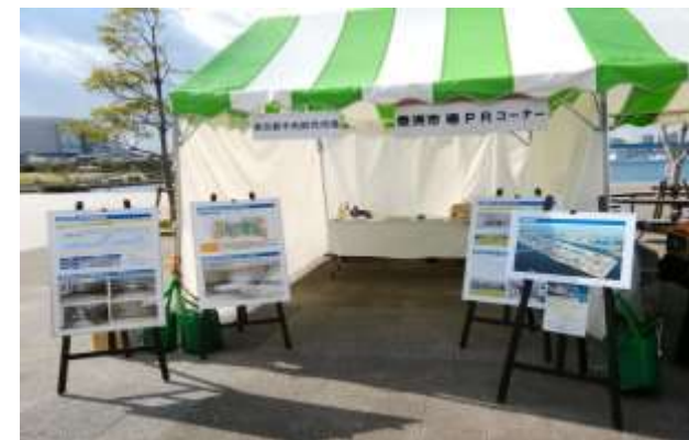
「江東湾岸まつり2017」PRパネル展示

受託事業者を選定し（11月）、今後、各種イベントへのブース出展や豊洲市場用地を活用した広報PRなどを実施予定