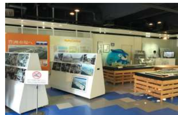
「東京いちばステーション」施設内の様子