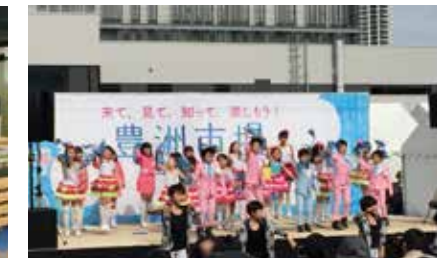
豊洲市場魅力発信フェスタ