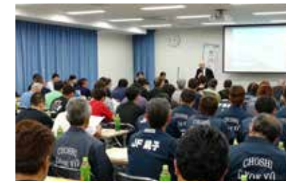
産地向け訪問PR事業の様子