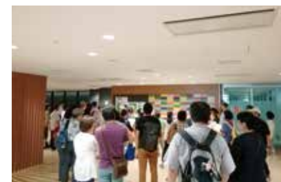
見学者通路 [青果棟]