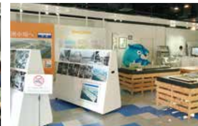
東京いちばステーション (築地市場)