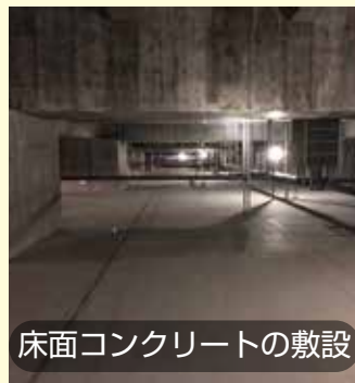
床面コンクリートの敷設