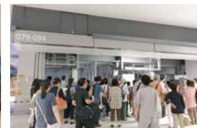
水産仲卸店舗 [水産仲卸売場棟]