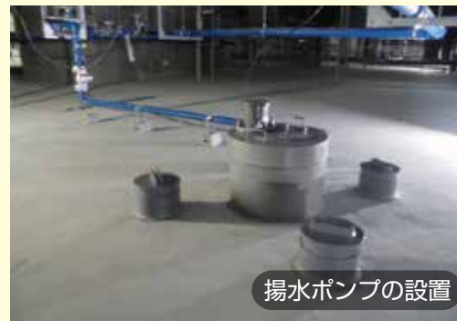
揚水ポンプの設置