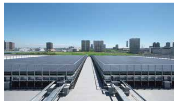
太陽光発電 (一般家庭の年間580世帯分の発電能力)