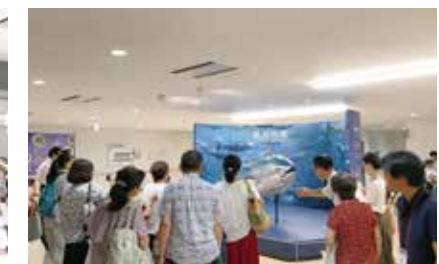
まぐろ (模型) [水産卸売場棟]