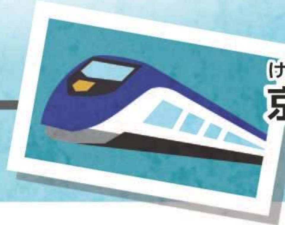
けいせいほんせん 京成本線