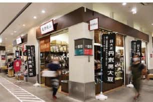
관련 상품 매장