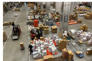
청과 도매장(데크에서 볼 수 있습니다.)