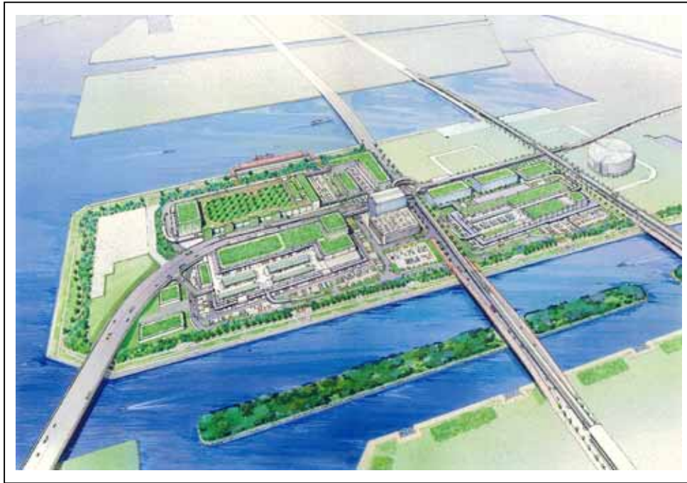
図 1-1 整備イメージ