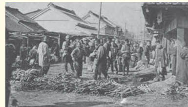
明治时代的神田蔬菜市场（蔬果市场）