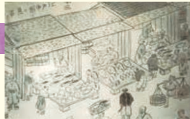
江户时代中期的鲜鱼市场