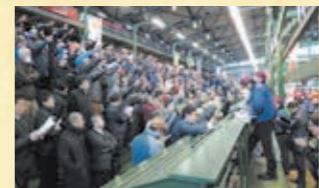
人工竞拍（水产品、蔬果）

在批发场地开始竞拍。在拍卖人（批发商）的主持下，竞拍人（经纪批发商及参加买卖者）出价，商品向出价最高者出售。