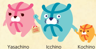
Yasachino Icchino Kochino