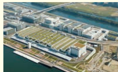
2018年投入运营的丰洲市场

1988年以后，在北足立市场等5个市场新开设了花木部。1989年，大田市场投入运营，成为11个市场。此后于2018年，作为首都圈新的主要市场，丰洲市场投入运营。