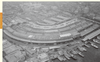
1964年当时的筑地市场

1935年开设了筑地、神田、江东3个市场，随后丰岛、淀桥、足立、肉类等市场投入运营。此后，为了满足城市人口增加等的需求，依次开设了板桥、世田谷、北足立、多摩新村、葛西等各个市场。