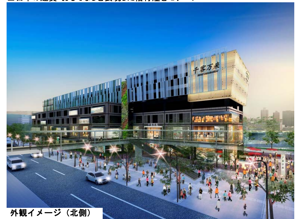
外観イメージ（北側）