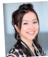
食の資格を多数取得 食育から市場を語るタレント 大桃 美代子氏