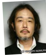
食通の立場から市場を 語るイラストレーター リリー・フランキー氏