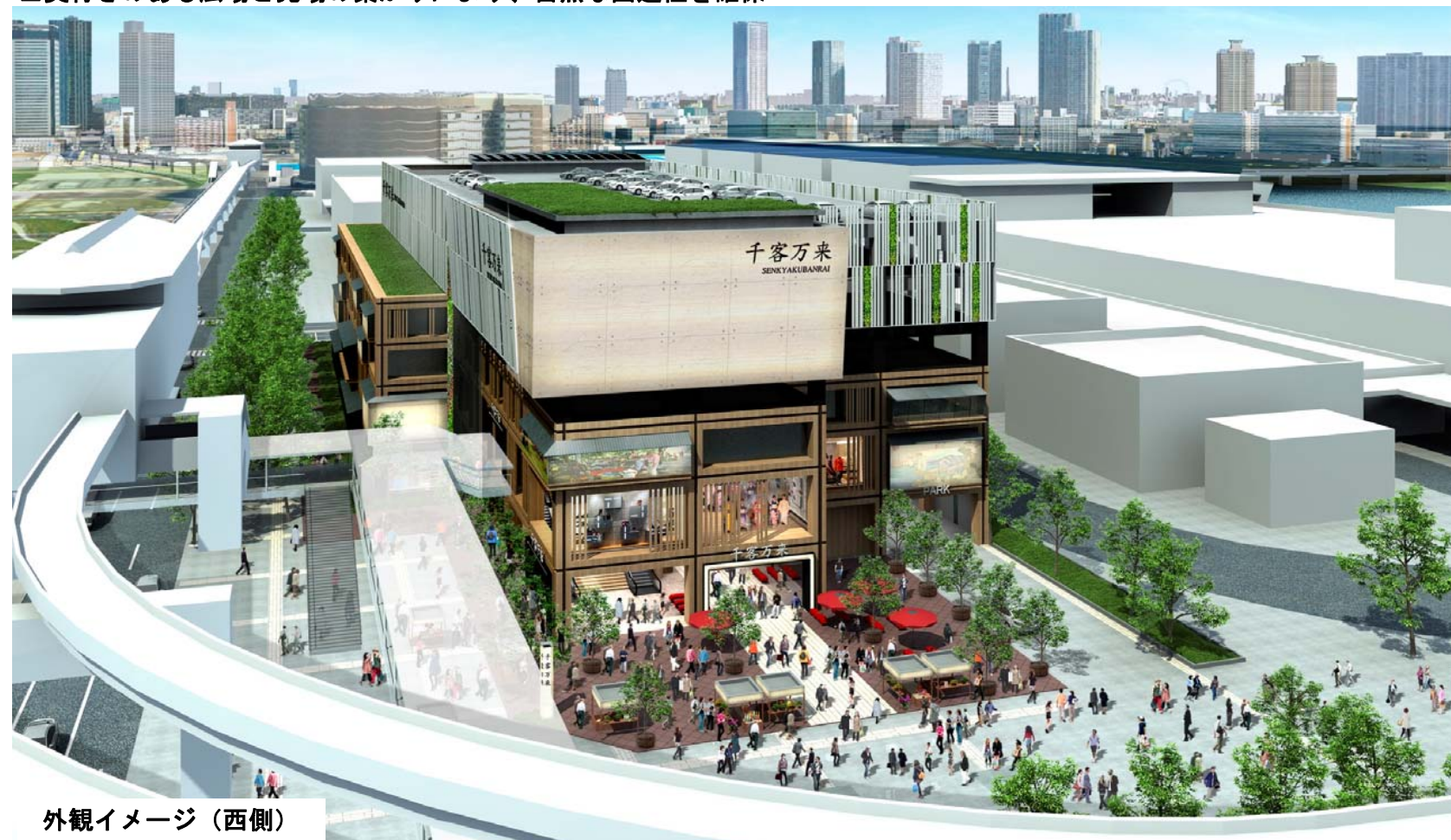
外観イメージ（西側）