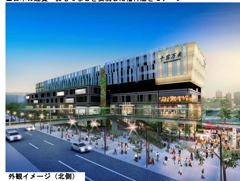
外観イメージ（北側）