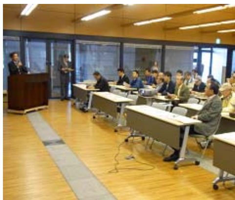
県センターでの放射性物質検査の説明