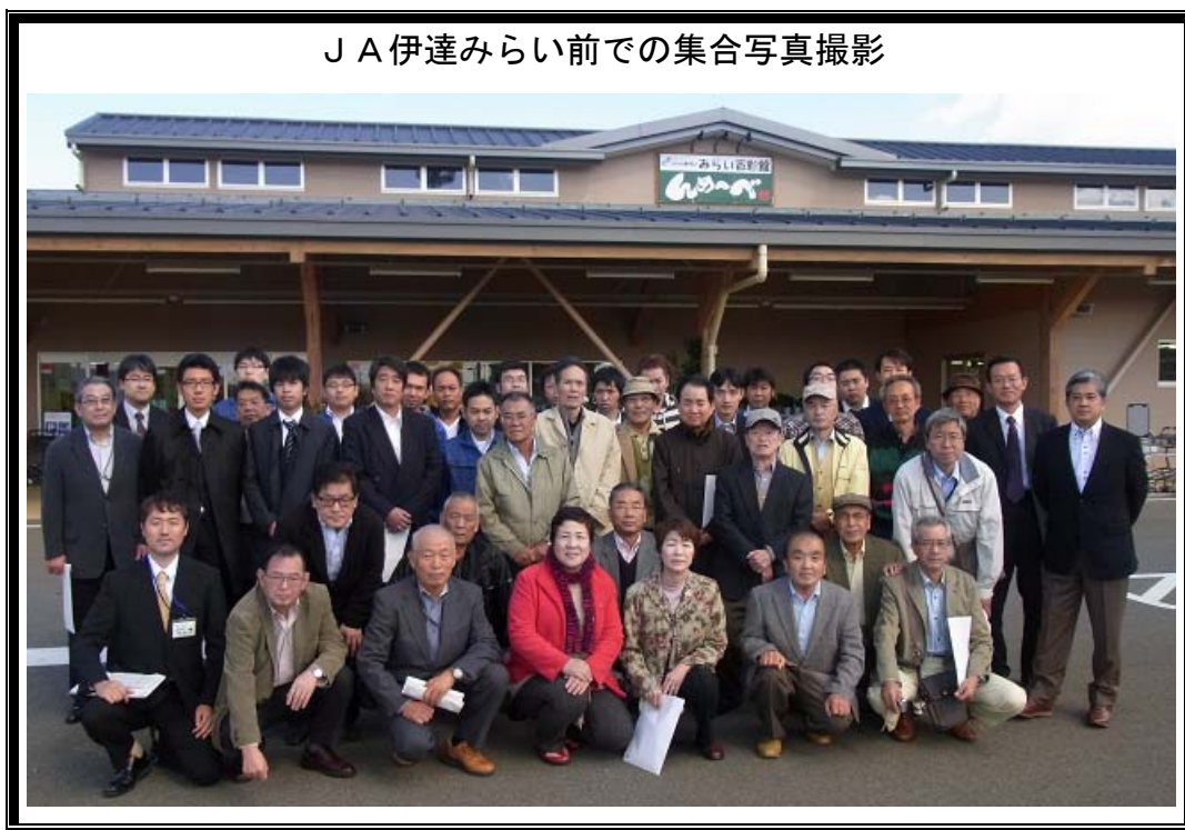
JA伊達みらい前での集合写真撮影

北足立市場からは総勢20名が参加し、福島県伊達市の「JA伊達みらい」と福島県郡山市の「福島県農業総合センター」を訪問し、放射性物質モニタリング検査状況の視察や産地の方々との意見交換などを行いました。