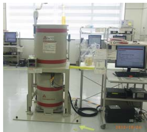
放射性物質モニタリング検査室