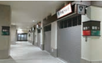
관련 상품 매장