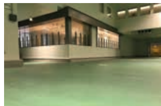
참치 경매 관람 데크

이곳은 국내외의 수산물을 모아 거래를 하는 장소입니다. 이곳에서는 관람자용 데크에서 참치의 경매를 가까이서 볼 수 있습니다.