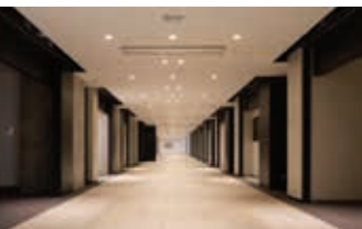
관련 음식 점포